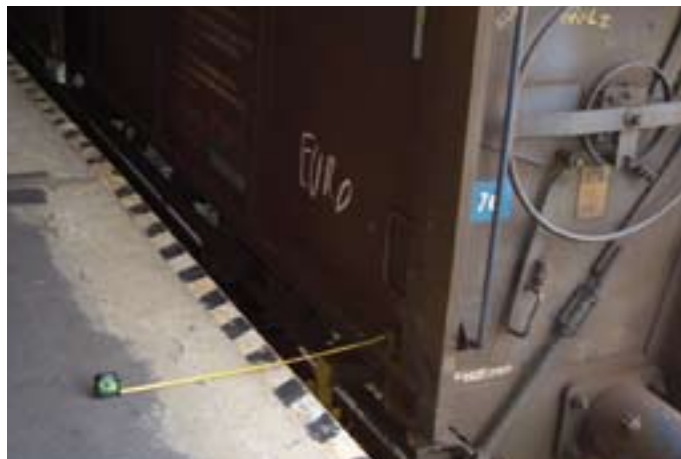
Testcenter on the road: Auch die RFID-Tauglichkeit von Eisenbahnwaggons wurde untersucht.

Standards und der neutralen und unabhängigen Testmethoden. Der Kunde hat die Möglichkeit, nur reine Hardwaretests durchzuführen und somit die Funktionalität der RFID-Technologie bei