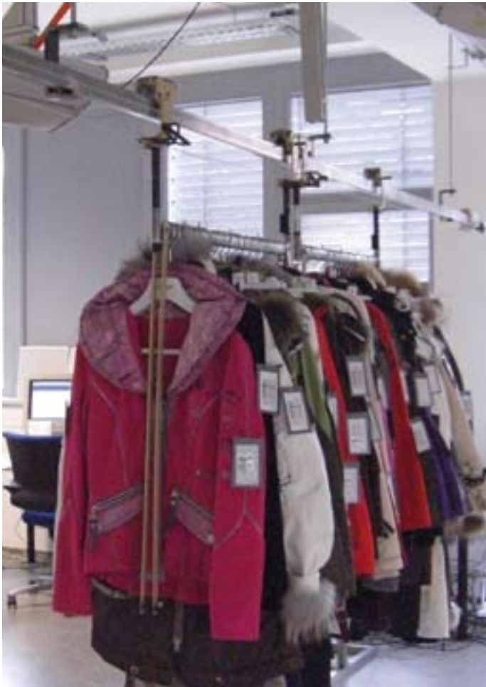
Winterbekleidung am Prüfstand: Die Textilindustrie zählt zu den erfolgversprechendsten RFID-Anwendungen.

Lesedistanz betrug 3 Meter – auch noch bei einer Geschwindigkeit von über 40 km/h, der maximalen Geschwindigkeit bei der Einfahrt in das Gelände. Da das gesamte Equipment schon beim Kunden vor Ort war, wurde auch noch die Erfassung von Eisenbahnwaggons erfolgreich getestet. Fazit: Mit dem richtigen Transponder