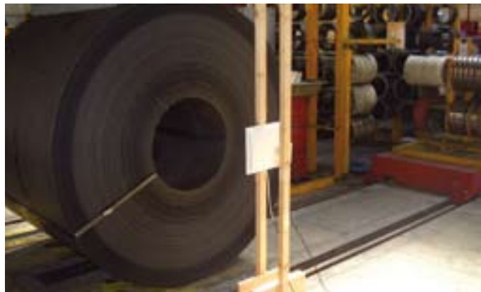
Wuppermann Bandstahl beauftragt das Testcenter mit der Suche nach einem Transponder, der in das „Auge“ des Stahl-Collis geklebt werden kann.

Der klare Fokus des Test CENTERS liegt auf der Unterstützung der österreichischen und internationalen Unternehmen im Umgang mit der RFID-Technologie, dem Nutzen und der Möglichkeiten innerhalb und außerhalb der unterschiedlichen Logistikketten. Der größte Nutzen für den Kunden liegt in der langjährigen Erfahrung der Mitarbeiter, der Nutzung der GS1/EPC-